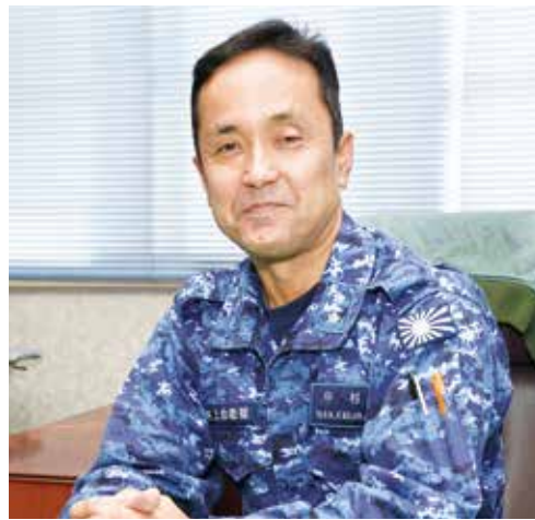
航空集団司令部幕僚長 海将補 中村 敏弘