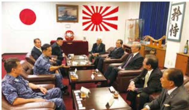
<中村敏弘 第5航空群司令への表敬訪問>

基地研修ですが、まずは海上自衛隊第5航空群の中村敏弘群司令（現在は航空集団司令部幕僚長）に表敬訪問。