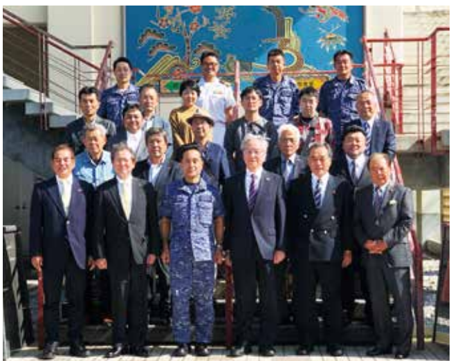
<海上自衛隊 第5航空群指揮官との記念撮影>

が一番おいしい」と太鼓判を押すカレーは、牛スジやきのこがふんだんに入っており食べ応え充分、味ももちろん絶品でした。ごちそうさまでした！