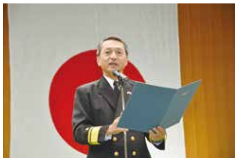
＜主催者挨拶 金嶋第4航空群司令＞

で、毎年多くの米軍人とその家族が訪れる。当日は4空群司令（金嶋浩司 海将補）の開会のあいさつの後、鏡開きが行われ、その後来賓によるもちつきが行われた。