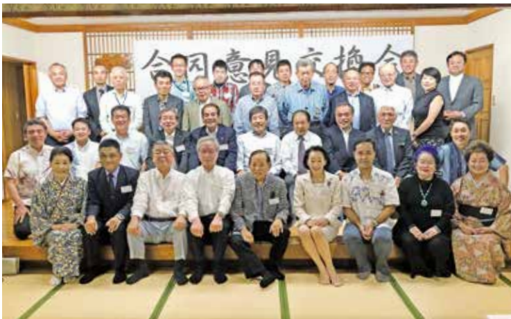
<合同意見交換会：琉球料理「料亭 那覇」にて>

官の皆様との合同意見交換会が開かれました。季節柄か土地柄なのか一見料亭には見えない佇まい、外国人観光客にも喜ばれそうな外観ですが、室内には大きなステージがあり琉球舞踊