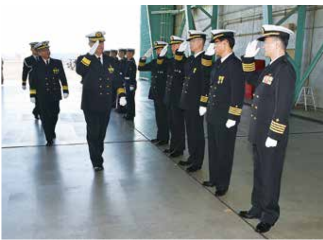
<平木 第4航空群司令 出迎え>

勤務は、平成24年夏から約1年間、第3航空隊司令として勤務させていただいてから今回で2回目であり、皆様と再びお会いさせていただくことを楽しみにしております。 航空集団司令部は海上自衛隊航空部隊のまさに中核であり、幕僚長として航空集団司令官をしつかりと支え、航空集団の隷下部隊が心置きなく与えられた任務や訓練に従事出来るよう意を払いながら勤務していく所存です。 前幕僚長と同様、変わらぬ皆様のご理解とご支援を賜りますようお願い申し上げますとともに、大和市自衛隊協力会の今後益々のご発展と、会員の皆様のご健勝を祈念いたしまして着任の挨拶とさせていただきます。