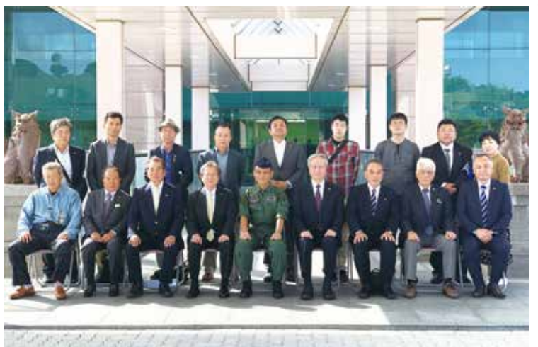
<航空自衛隊第9航空団 空将補 稲月団司令との記念撮影>